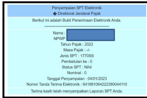
Contoh bukti lapor SPT/LHKAN