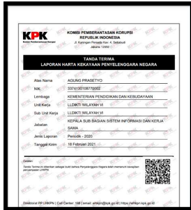
Contoh bukti lapor LHKPN