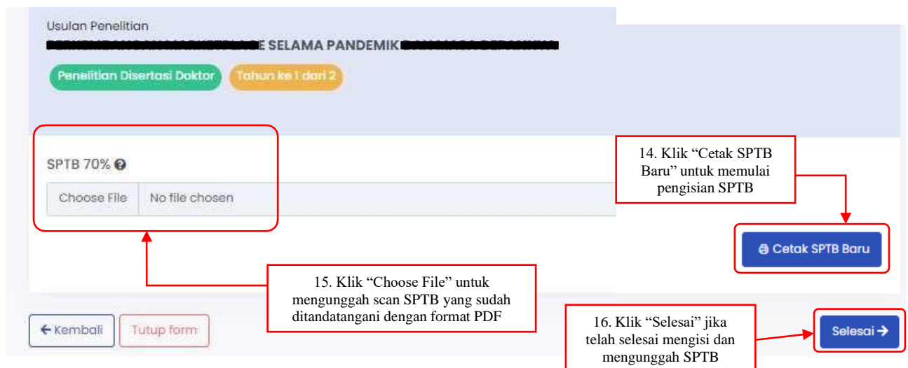
Gambar 6. Menu Surat Pertanggungjawaban Belanja 70%