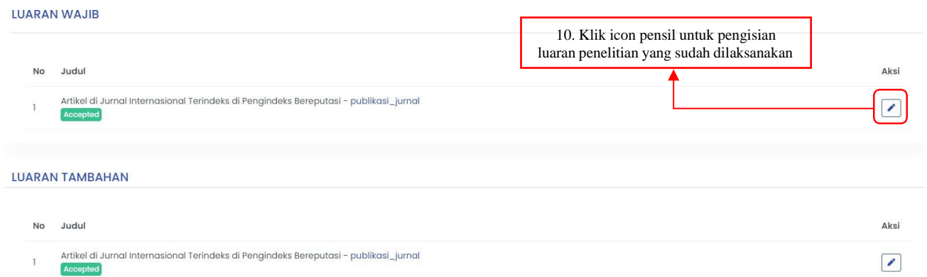
Gambar 4. Menu luaran wajib dan tambahan

Selanjutnya Peneliti diharuskan melengkapi isian luaran wajib dan luaran tambahan (jika didanai dalam kontrak) sesuai yang dijanjikan dalam proposal beserta mengunggah dokumen pendukung capaian dengan mengklik icon “✎”. Penjelasan secara lengkap target dan isian luaran wajib pada setiap tahun pelaksanaan dapat dilihat pada Buku Panduan Penelitian dan Pengabdian kepada Masyarakat Tahun 2023. Pada Gambar 4 di bawah ini adalah contoh tampilan isian luaran.