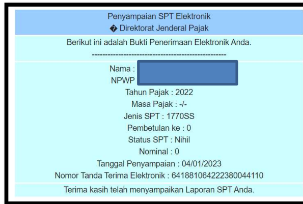
Contoh bukti lapor SPT/LHKAN