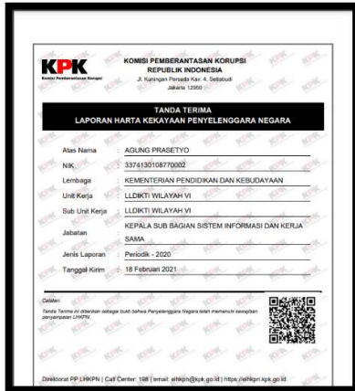
Contoh bukti lapor LHKPN