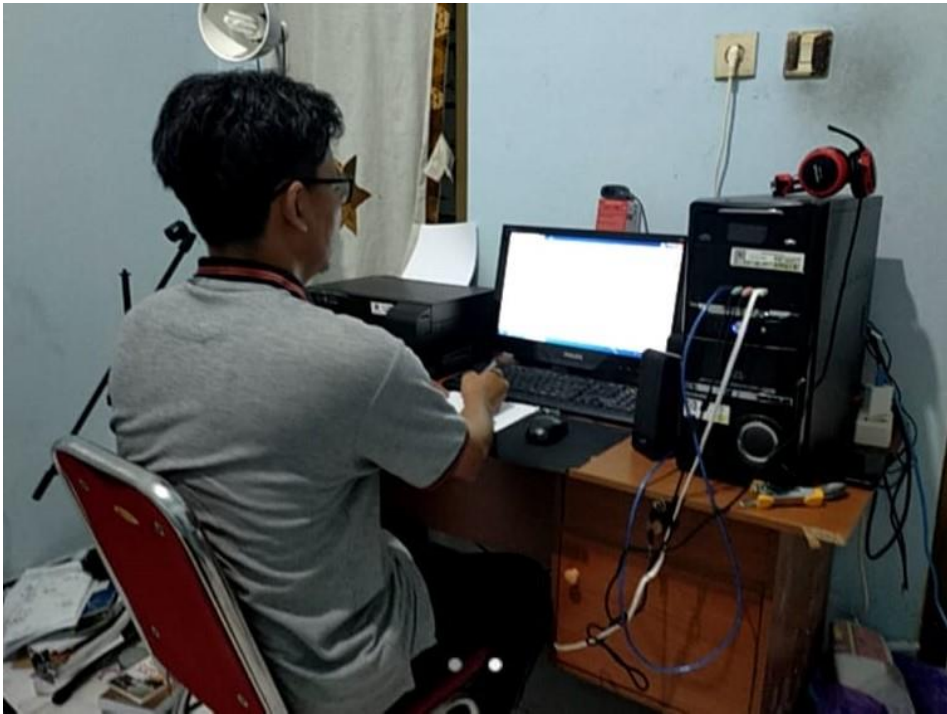
Gambar 1. Kamera zoom diletakkan pada posisi yang dapat memperlihatkan suasana meja pengerjaan soal.